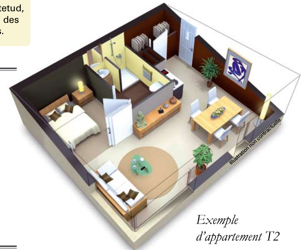
Exemple d'appartement T2

Fort de son succès et d'une solide expérience, Gestetud axe son développement sur la commercialisation de résidences services dédiées aux séniors au travers de sa filiale GESTEA.