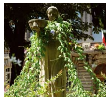
Place Jean Macé

C'est au cœur du 7 ème arrondissement de Lyon, sur l'Avenue majeure Berthelot, que le Groupe Confiance a choisi d'implanter sa nouvelle Résidence Séniors « Dolce Vita ». A proximité de la Place Jean Macé et du quartier de la Part-Dieu , celui-ci est desservi par le Tramway qui place l'Hypercentre à seulement 10 minutes de trajet.